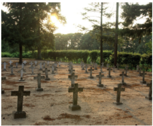
Begraafplaats Merksplas Kolonie